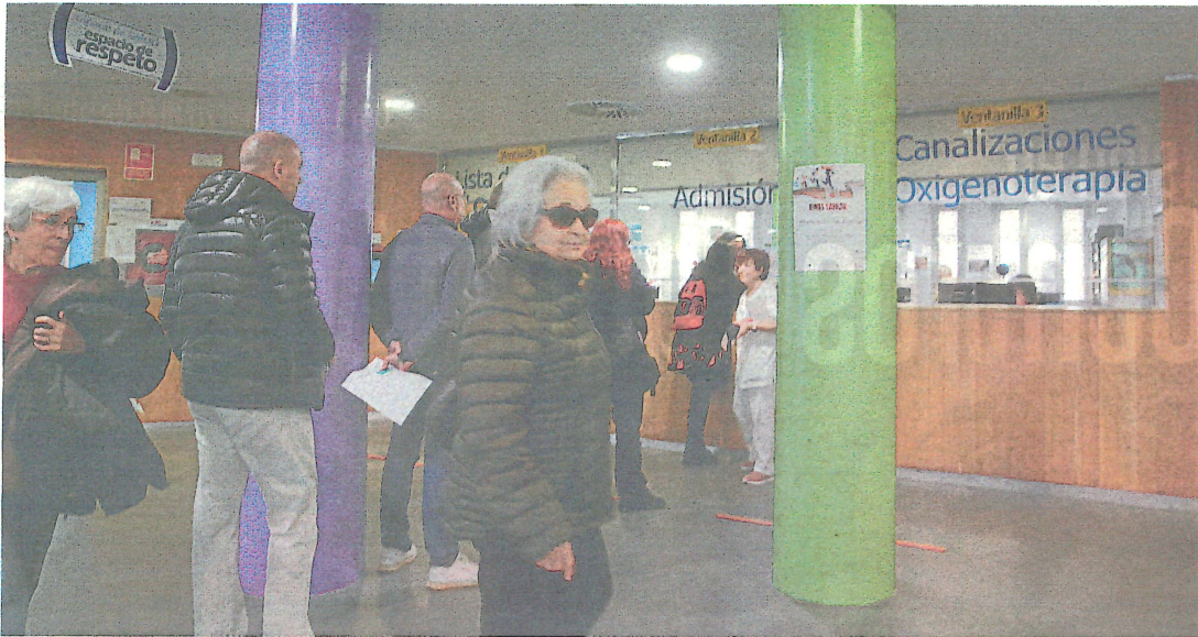
Cola para la ventanilla de admisiones en el Hospital General de Segovia.