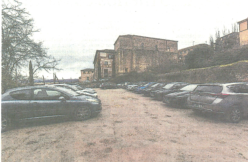
Solar donde aparcen ahora los trabajadores del Hospital Recoletas de Segovia, que será edificado en el futuro.

El concejal y primer teniente de alcalde, que hasta mañana jueves a las 22 horas actúa como alcalde en