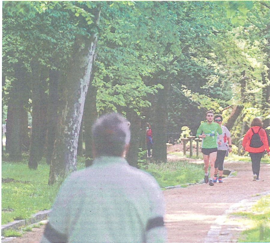
Las personas alérgicas deben extremar las precauciones al realizar actividades al aire libre.

Los datos históricos ayudan a poner estas cifras en contexto. En Segovia, los niveles de polen pueden dispararse en pocas semanas y alcanzar picos muy elevados. En algunos días de la primavera pasada se superaron las 2.000 partículas por metro cúbico, cuatro veces por