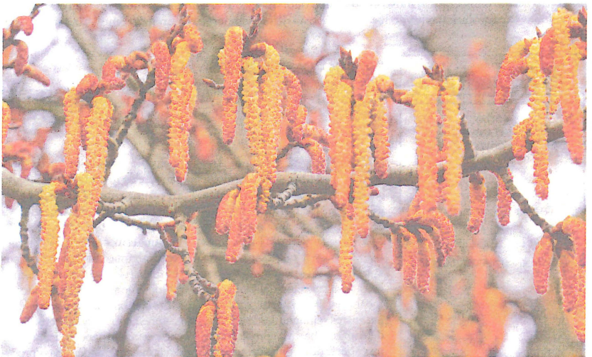
Álamos y alisos son de los primeros en florecer y esparcir polen.