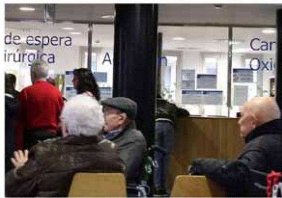
Usuarios en el Complejo Asistencial Universitario de Segovia, en la zona de la recepción de la lista de espera quirúrgica. A. de Tena