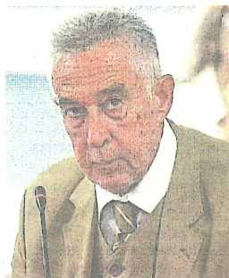
El doctor, durante el juicio.