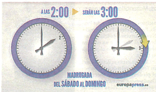
La madrugada de este 29 de marzo cambiará la hora.