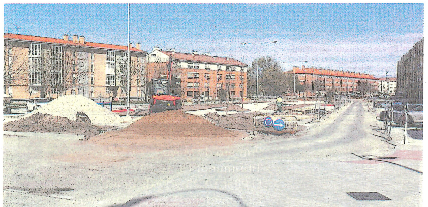
Estado de ejecución de los trabajos esta semana en la plaza de Bécquer del barrio de Nueva Segovia.

El gobierno del PP reconoce retrasos pero los achaca a las condiciones meteorológicas adversas del invierno, con un tren de borrascas que ha incluido varias nevadas, heladas e intensas precipitaciones de lluvia, así como al 'parón' por los días vacacionales del convenio del sector de la construcción, a caballo entre diciembre y enero. La predicción que han lanzado tanto el alcalde, Jo-